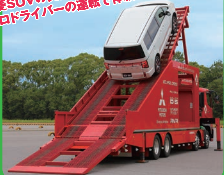
SUV登板キット体験試乗会 (当日受付制)

驚異の45度登坂 三菱SUVの実力、走行性、安全性を プロドライバーの運転で体験しよう