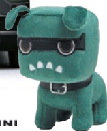
「デリカミニ」オフロード試乗会 (当日受付制)