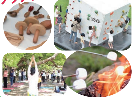
※アクティビティはイメージです。